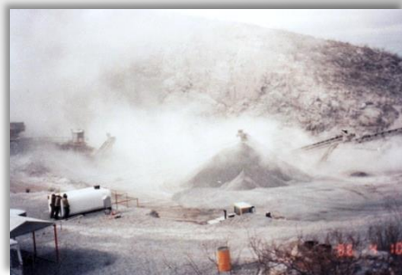
Mina antes de instalar el sistema de Niebla Seca.

La agencia de protección del medio ambiente de los Estados Unidos (EPA) menciona el uso de sistemas de supresión de polvo por niebla seca. En su documento “Técnicas de Control de Materia Particulada”, se refiere al empleo de niebla seca para suprimir el polvo en transferencias: “ La Niebla Seca es un dispositivo para controlar las emisiones fugitivas de polvo proveniente de puntos de transferencia ... En el dispositivo de "Niebla Seca", una niebla de gotitas de tamaño micrométrico es generada por boquillas. El agua humedece el material y desata la aglomeración de las partículas de polvo hasta tamaños suficientemente grandes como para sedimentarse. Una vez que las gotas con polvo llegan al fondo (a la banda), el agua se evapora dejando el material seco... ”