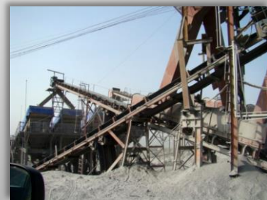
Mina con sistema de Niebla Seca en Cribas y Bandas