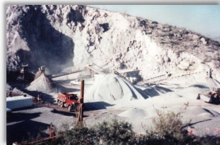
La misma mina tres meses después con el sistema de Niebla Seca.