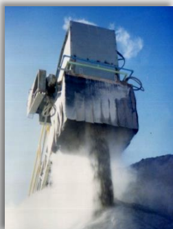
Descarga de banda en apilamiento con aspersores de Niebla Seca formando un anillo.