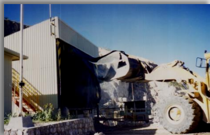
Tolva cubierta con caseta y sistema de Niebla Seca actuado automáticamente.